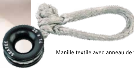
Manille textile avec anneau de friction