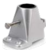
Embaise de chandelier

Rails de fargue Pfeiffer Marine en aluminium et accessoires. Les rails sont disponibles en 4, 5 et 6 mètres de long avec des extrémités angulées à 80°. Un chaumard sert de pièce de jonction. Multiples accessoires : chaumards, taquets, cadènes, embouts.