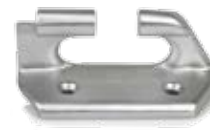
Embout avec chaumard