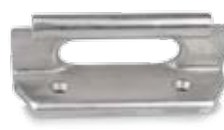
Pièce de jonction avec chaumard