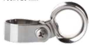
Réf. 80011 filoir de chandelier € 22,95

Filoir de chandelier Filoir de chandelier pour faire courir des manoeuvres le long des filières (bosses d'enrouleurs, focs auto-vireurs, etc...) Acier inox V4A, pour tube de 25 mm. Diamètre de l'oeil : 20 mm