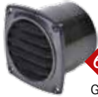
6 Ø 75 mm Grille de ventilation avec conduit