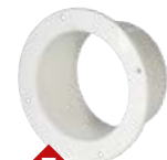
7 Manchon de ventilateur, droit