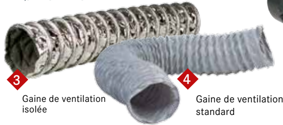
3 Gaine de ventilation isolée