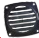
6 Grilles de ventilation sans manchons