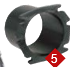
5 Ø 75 mm Manchon pour montage traversant